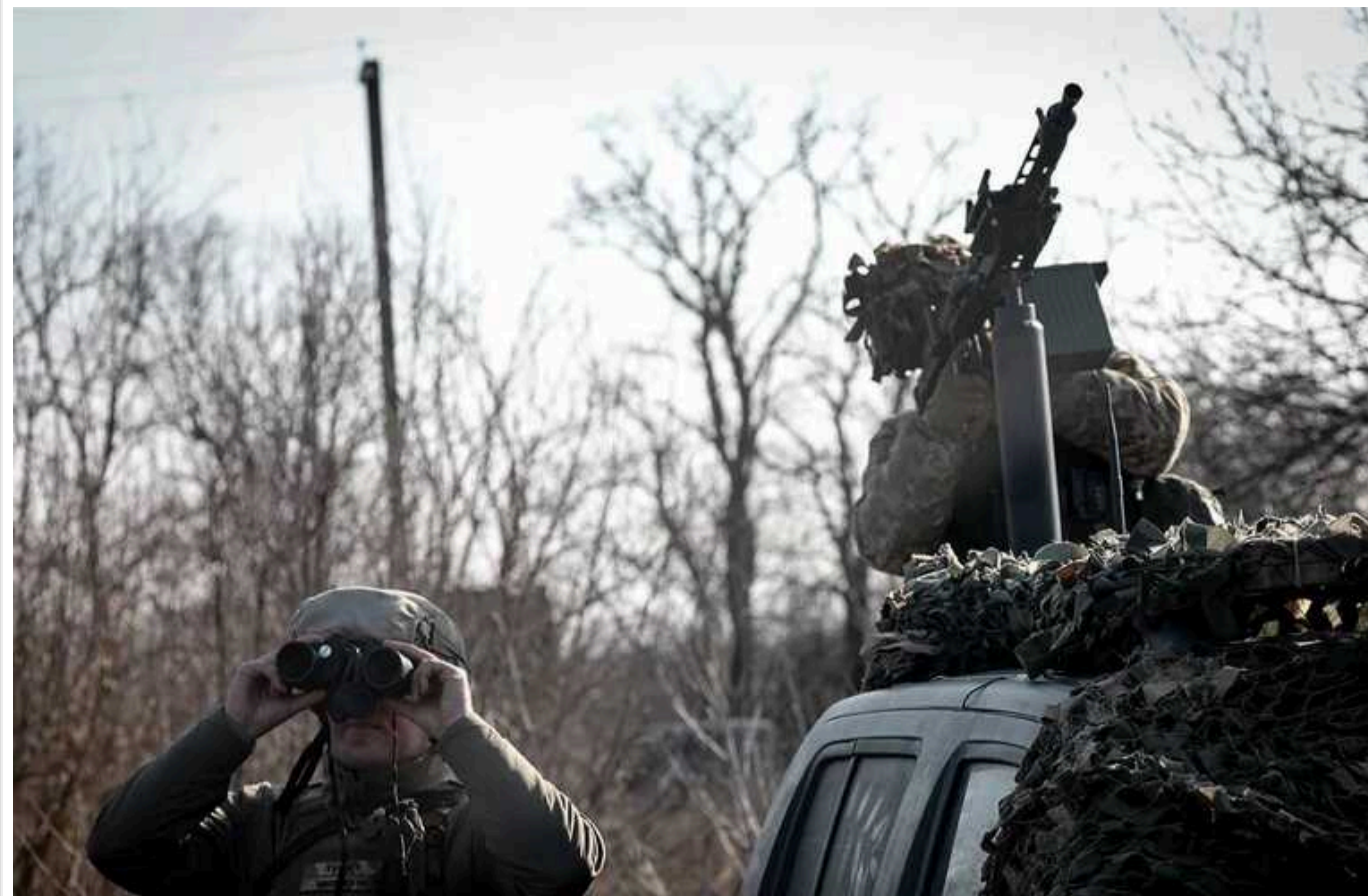
РФ влаштувала масовану атаку на Україну, 59 із 76 повітряних цілей збили сили ППО, – ПС ЗСУ

Вночі та на світанку 8 травня, у День пам'яті та примирення, Росія влаштувала масовану повітряну атаку на Україну, застосувавши ракети та "шахеда". Захисники неба знищили 59 повітряних цілей: 39 ракет та 20 дронів-камікадзе.