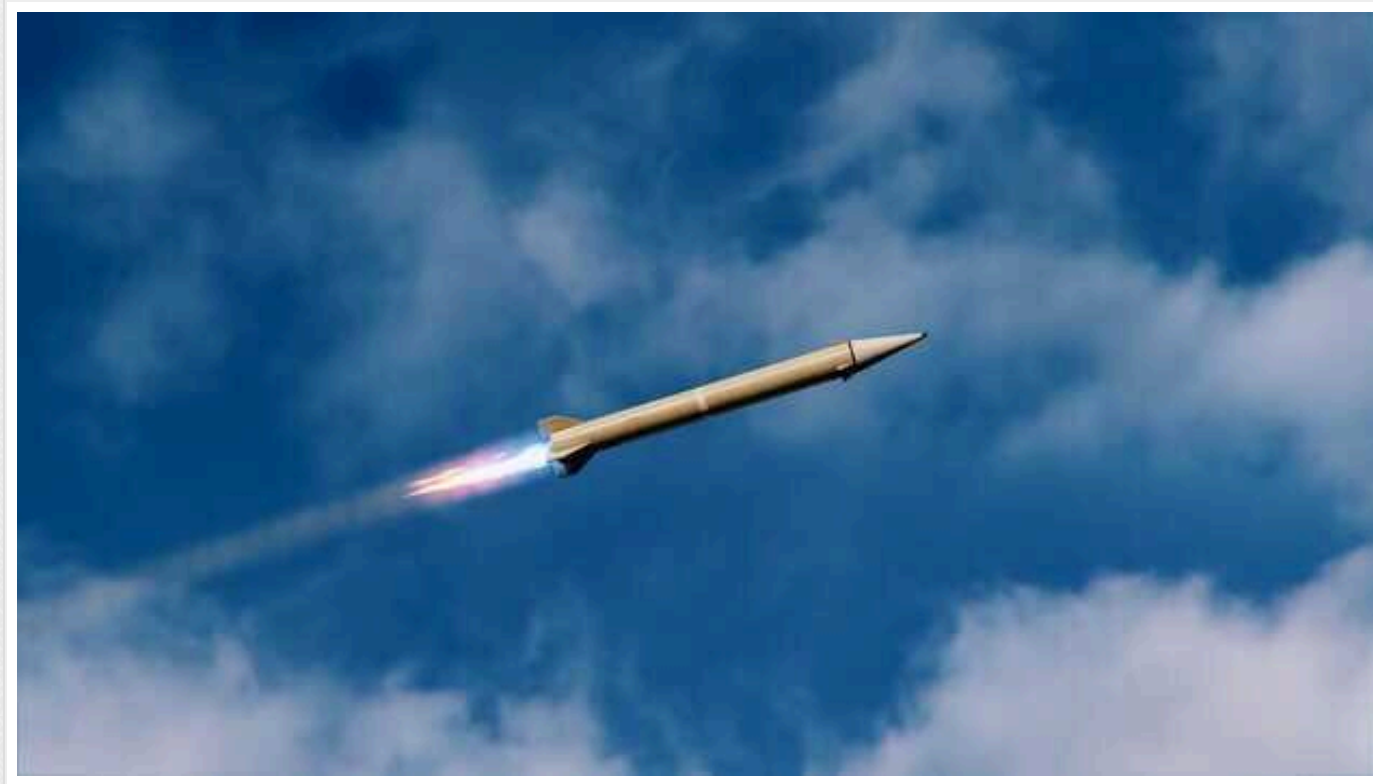
Половина ракет КНДР, якими Росія атакувала Україну, виявилися несправними

Близько половини північнокорейських ракет збилися із запрограмованої траєкторії та вибухнули у повітрі.