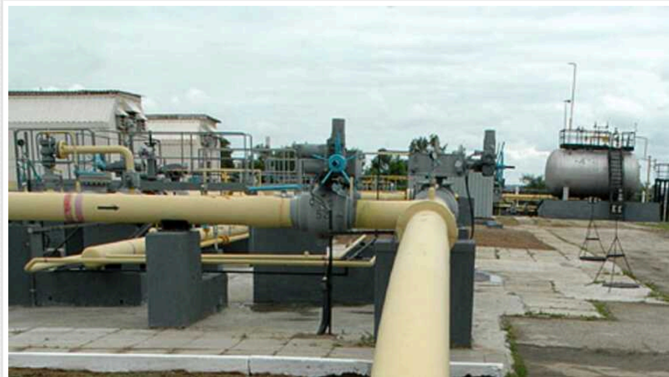
Уряд виділив майже 170 мільйонів на аміакопровід, який не працює

Кабмін виділив Фонду державного майна 168 млн гривень на утримання аміакопроводу Тольятті-Одеса в належному стані. За повідомленнями, зараз об'єкт не працює.