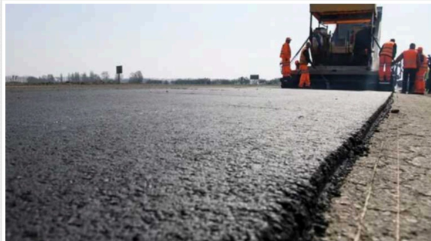
На ремонт дороги у прифронтовій Костянтинівці хочуть витратити 50 мільйонів гривень

У прифронтовій Костянтинівці хочуть відремонтувати дороги за 50 млн. грн.