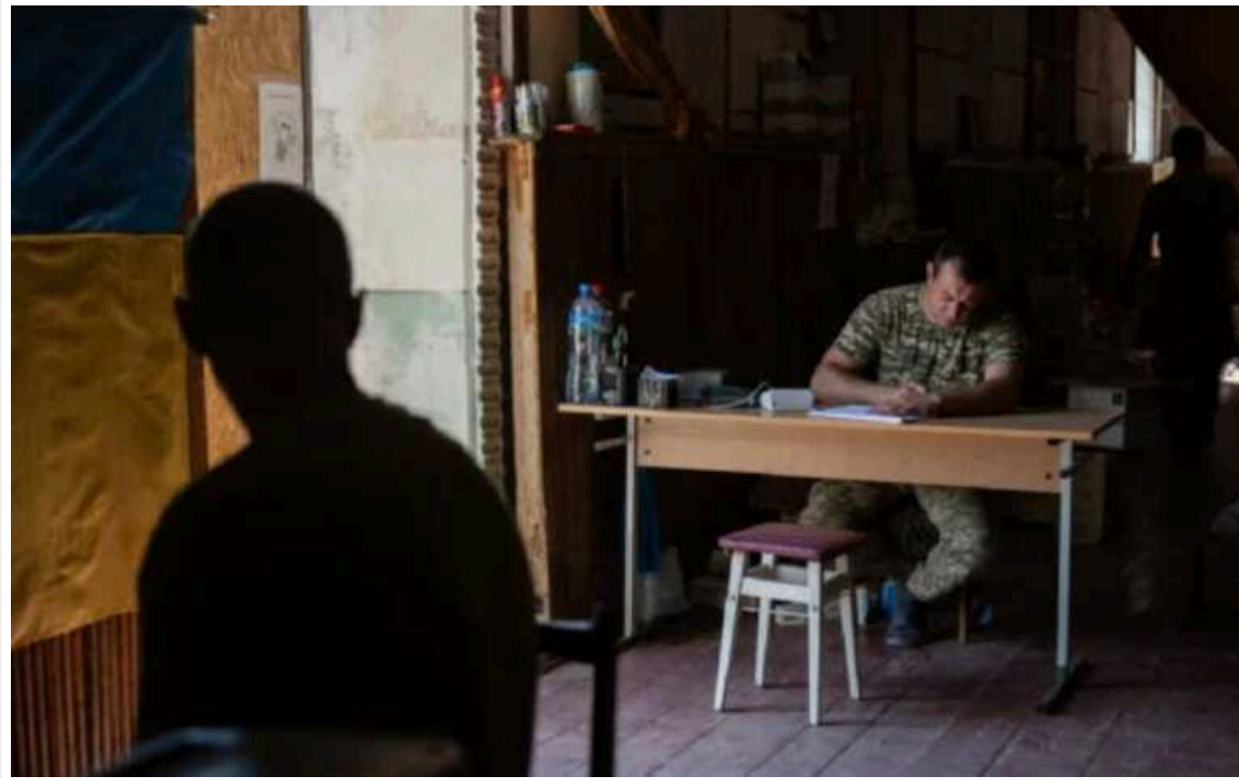
У Хмельницькому ТЦК погрожує тим, хто знімає дії його співробітників на відео

ТЦК бачить у цьому ознаки статті 114-1 ККУ (перешкоджання законній діяльності ЗСУ та інших військових формувань у особливий період), за що передбачено відповідальність у вигляді позбавлення волі від 5 до 8 років.