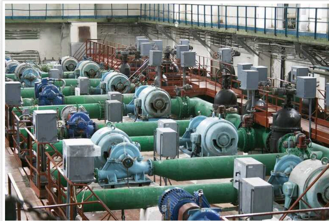
КП "Броваритепловодоенергія" через «заточки» замовили хімію для очищення води на чверть дорожчу за Бориспіль та Обухів

КП «Броваритепловодоенергія» Броварської міської ради Київської області 16 квітня за результатами тендера замовило ТОВ «НПП Лаваль» хімії на 13,70 млн грн.