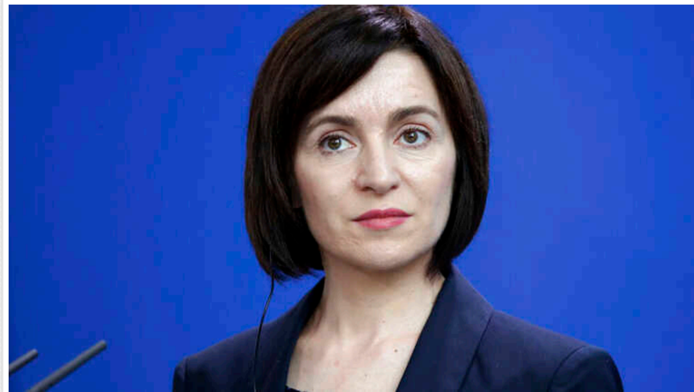
Молдова зробить усе для збереження миру, але якщо Росія нападе – захищатиметься, - Санду

Президентка Молдови Мая Санду каже, що офіційний Кишинів зосередить зусилля, аби звести до мінімуму ризик російської агресії проти себе, але у разі такого сценарію буде захищатися.