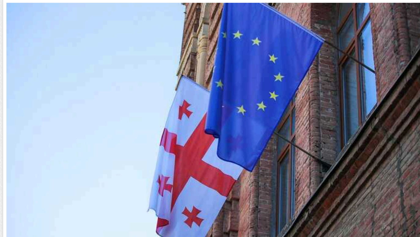
Більше 30 депутатів Європарламенту просять забрати у Грузії статус кандидата

Понад 30 депутатів Європарламенту закликали віцепрезидента Єврокомісії і главу дипломатії Євросоюзу Жозепа Борреля призупинити для Грузії статус кандидата на вступ в ЄС.