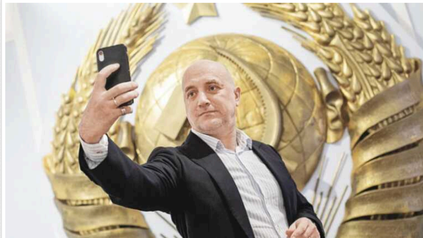
Екскрадник убитого «голови ДНР» Захарченка визнав, що РФ здатна лише знищувати Донбас