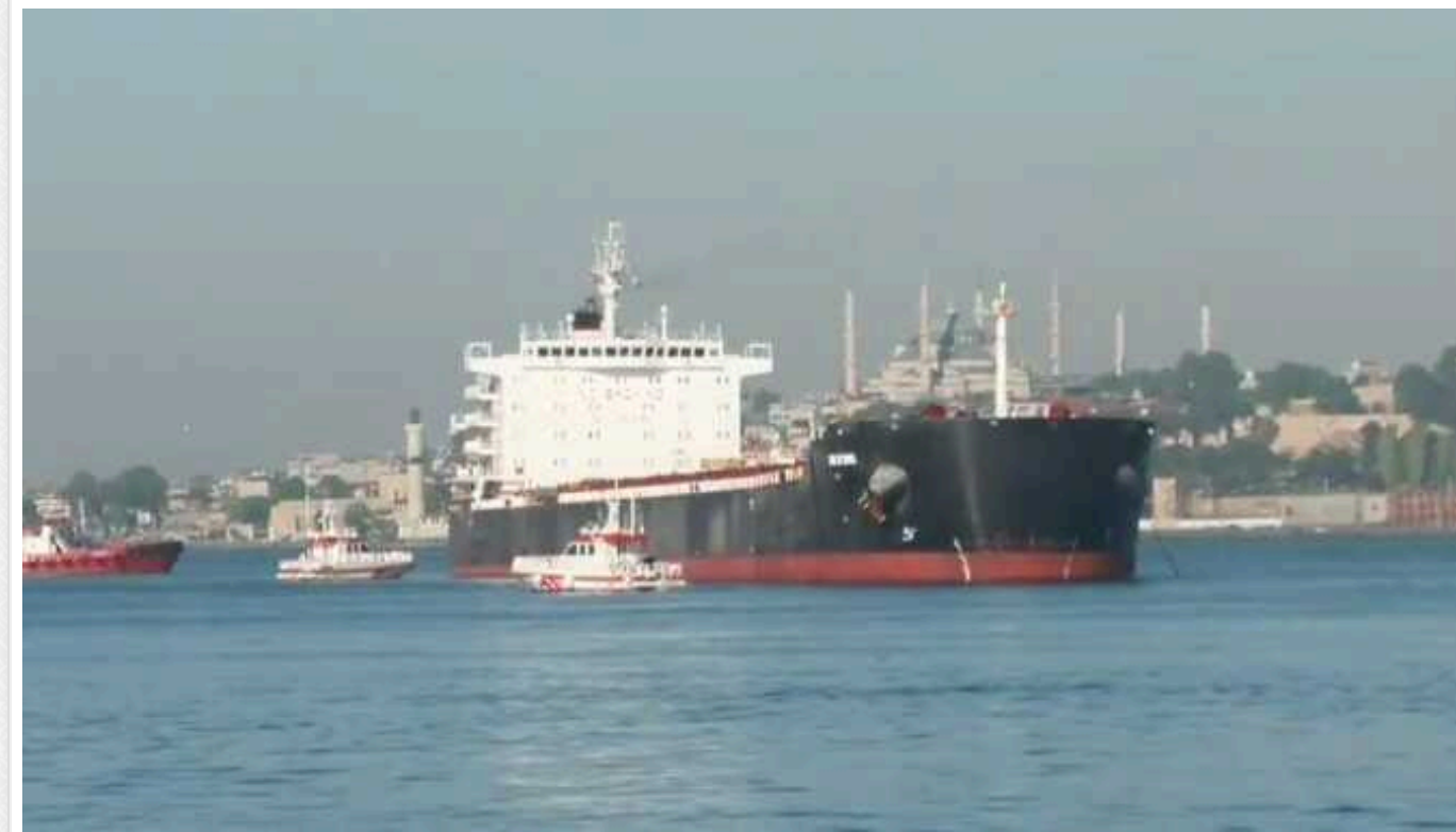
У протоці Босфор на міліну сіло судно, що прямувало з України до Єгипту

У протоці Босфор призупинили рух через інцидент із суховантажем Alexis, який прямував з України до Єгипту і сів на міліну.