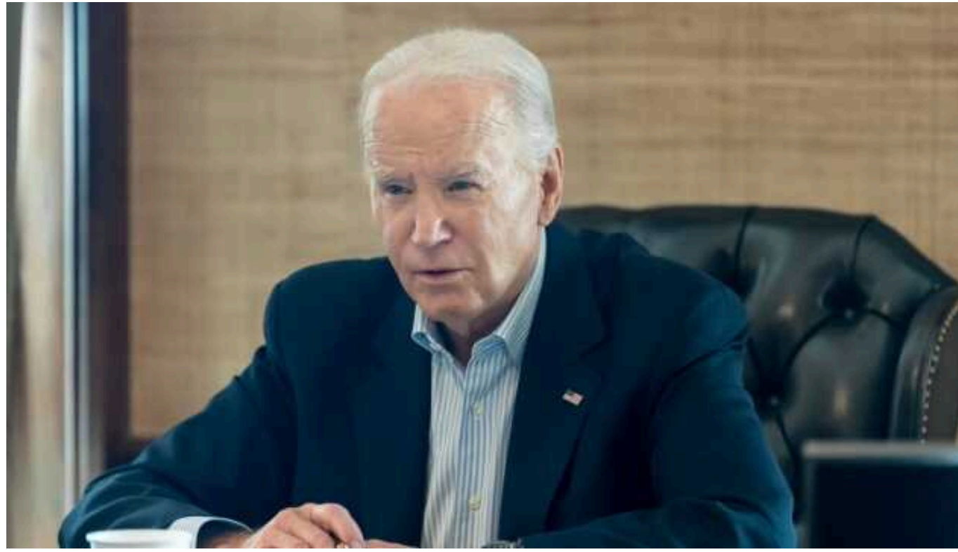
Байден та король Йорданії обговорили ситуацію в Секторі Гази

Президент США Джо Байден і король Йорданії Абдалла II на зустрічі в Білому домі обговорили розвиток подій у Секторі Гази та підтвердили прихильність до встановлення миру в регіоні.