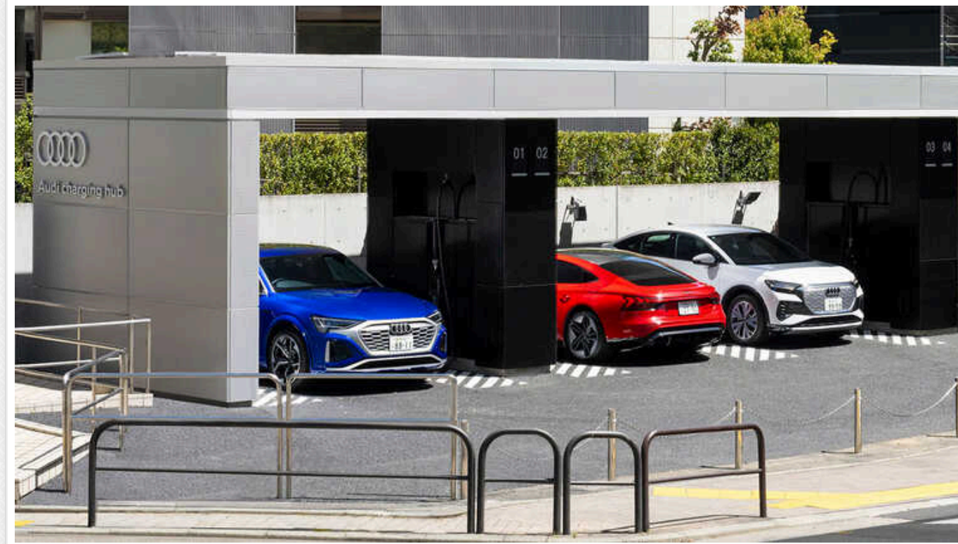
У столиці Японії відкрився перший зарядний центр Audi за межами Європи

Німецька компанія Audi збудувала в Токіо перший за межами Європи потужний центр швидкої зарядки електромобілів, намагаючись стимулювати їх поширення в Японії, де ця технологія впроваджується доволі повільно.