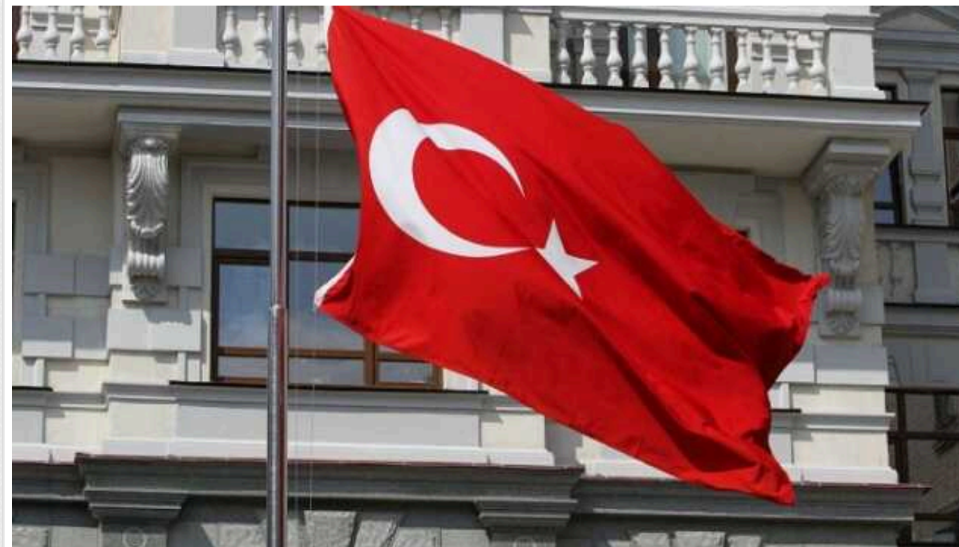
Туреччина проведе антитерористичні операції на півночі Сирії та Іраку

Туреччина найближчим часом проведе антитерористичні операції на півночі Іраку та Сирії.