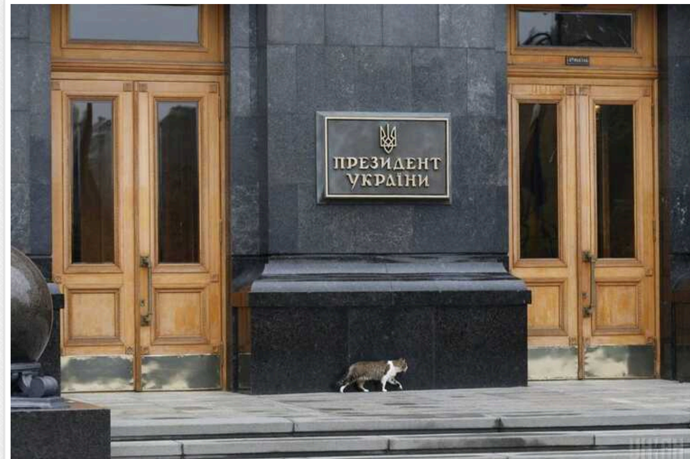
В ОП сподіваються вже у травні фіналізувати безпекову угоду із США

В Офісі Президента України кажуть про "відчутний прогрес" у роботі України і США над двосторонньою безпековою угодою у продовження декларації G7 про "гарантії безпеки" та сподіваються погодити фінальний текст вже у травні.