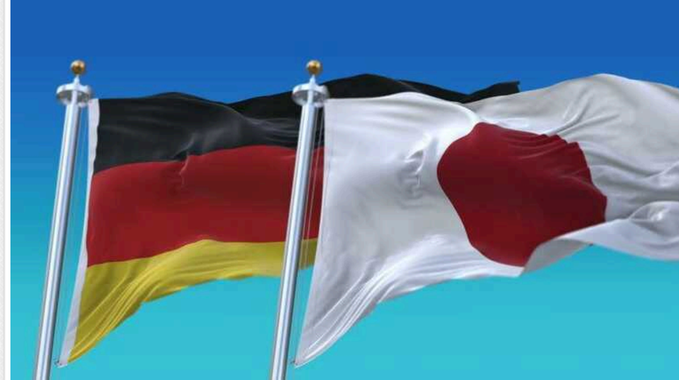
Німеччина та Японія вперше проведуть спільні навчання сухопутних військ

Німецька армія приєднається до навчань із Сухопутних сил самооборони Японії вже наступного року на тлі нарощування військової могутності Китаю в Індо-Тихоокеанському регіоні.