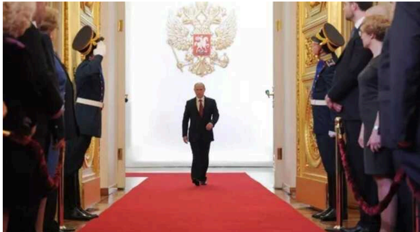
Reuters: Частина країн Євросоюзу вирішила взяти участь в «інавгурації» Путіна

20 країн-членів Євросоюзу бойкотуватимуть так звану інавгурацію на черговий президентський термін російського диктатора Володимира Путіна, проте 7 інших країн ЄС нібито планують взяти участь у події, направивши своїх представників.