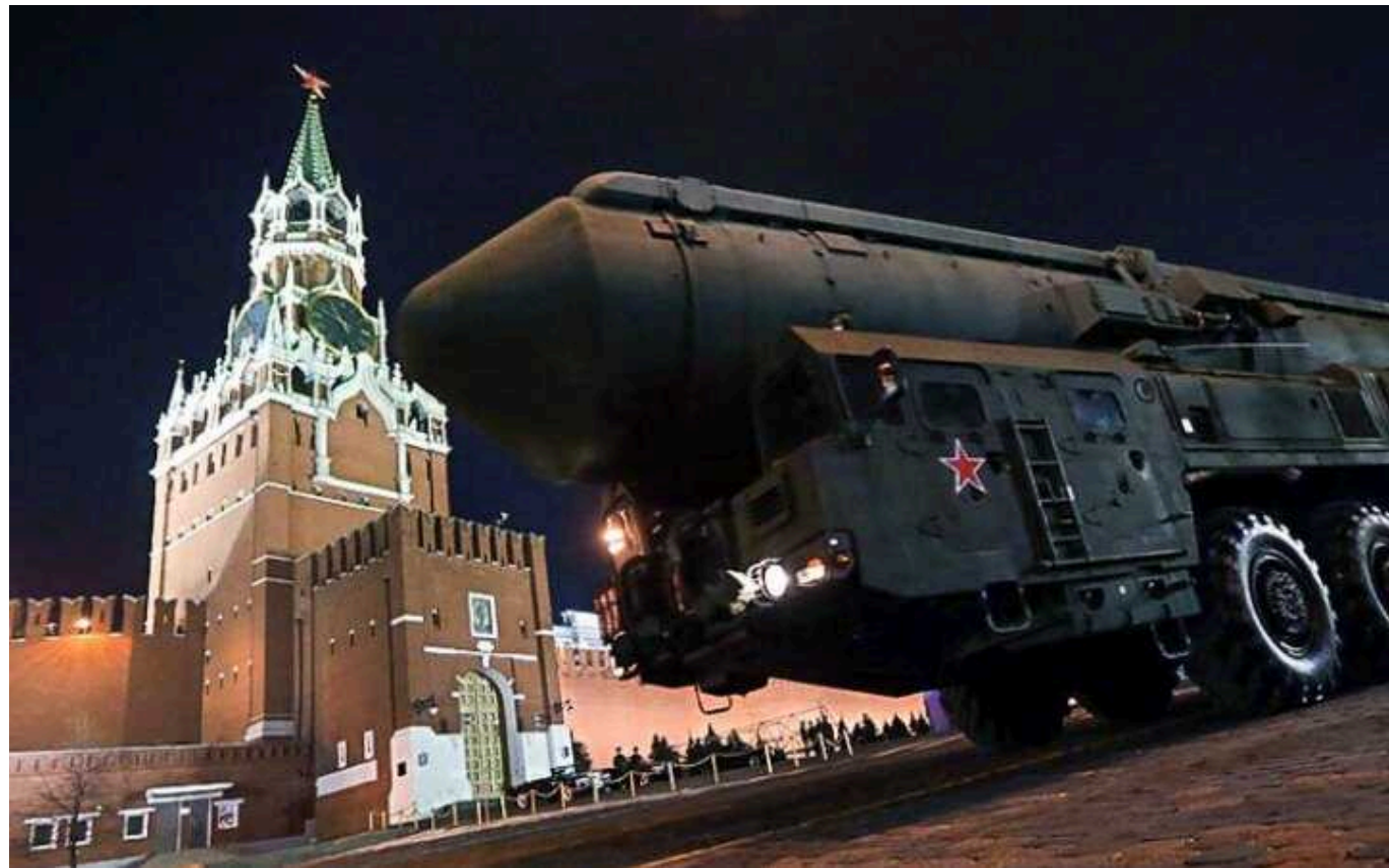
Кремль використовує ядерні погрози і дипломатичний шантаж, щоб контролювати Захід, – ISW

Кремль знову активізує кампанію рефлексивного контролю, спрямовану на прийняття рішень на Заході, використовуючи ядерні погрози та дипломатичні маніпуляції.