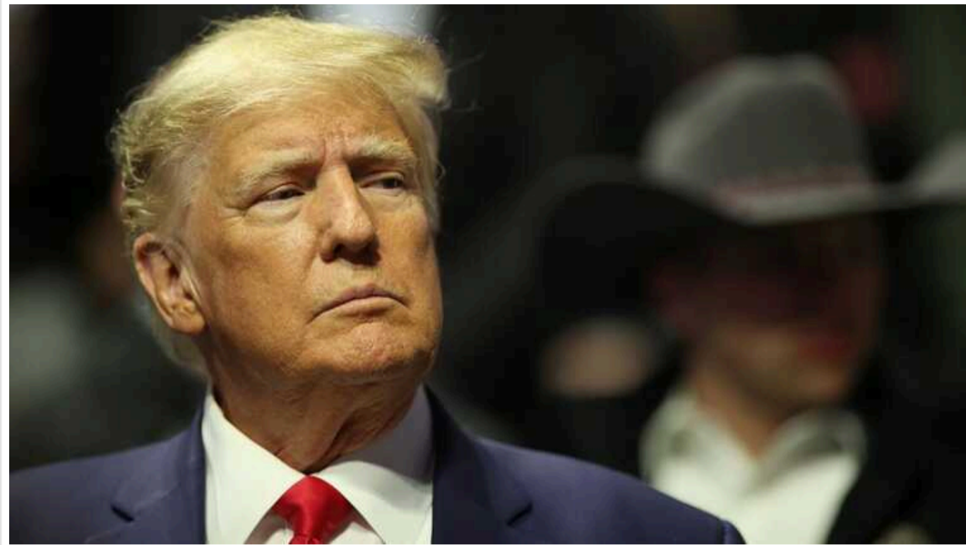
У США суд може відправити Трампа за ґрати ще до закінчення процесу

Суддя у справі Дональда Трампа про виплату грошей актрисі Стормі Деніелс оштрафував його на $1,000 і вдесяте визнав його винним у неповазі до суду за порушення наказу про нерозголошення інформації. Суддя також попередив президента, що подальші порушення можуть призвести до взяття під варту.