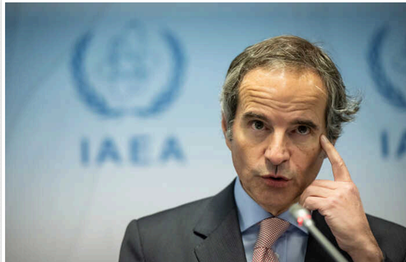
Reuters: Глава МАГАТЕ Гроссі прагне посилити ядерний контроль в Ірані

У понеділок глава ядерної служби ООН Рафаель Гроссі прилетів до Ірану, сподіваючись посилити нагляд МАГАТЕ за атомною діяльністю Тегерана, але аналітики та дипломати кажуть, що він має обмежені важелі впливу та повинен остерігатися порожніх обіцянок.