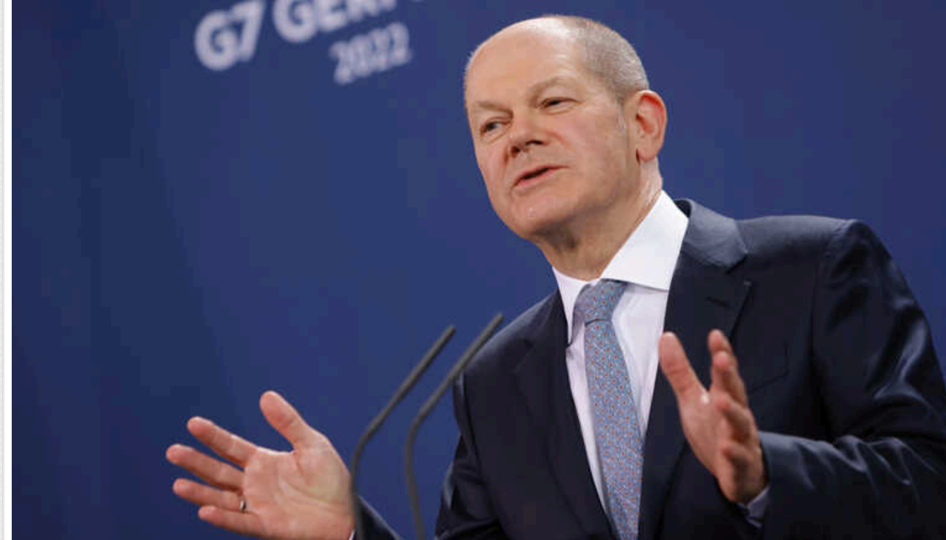
Шольц: Німеччина готова оперативно направити 35 тисяч військових для підтримки союзників

Німеччина готова оперативно розгорнути свої сили задля підтримки союзників у кількості 35 тисяч підготовлених військовослужбовців.