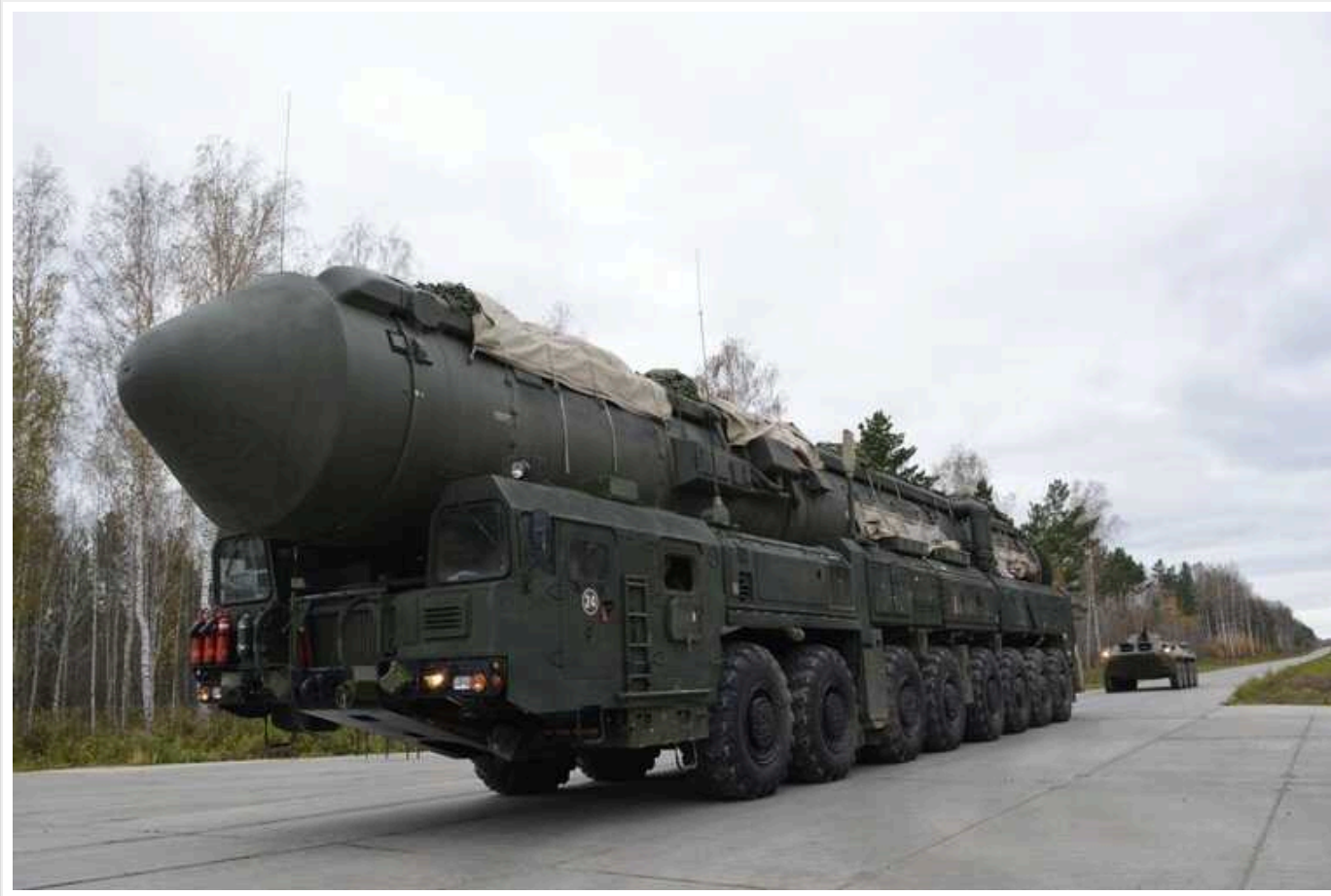
У Пентагоні прокоментували ядерні навчання РФ

РФ погрожує ядерними навчаннями, але насправді це приклад безвідповідальної риторики Кремля. Про це заявив представник Пентагону, бригадний генерал ВВС Пет Райдер, повідомляє кореспондент Politico Лара Селігман у Twitter .