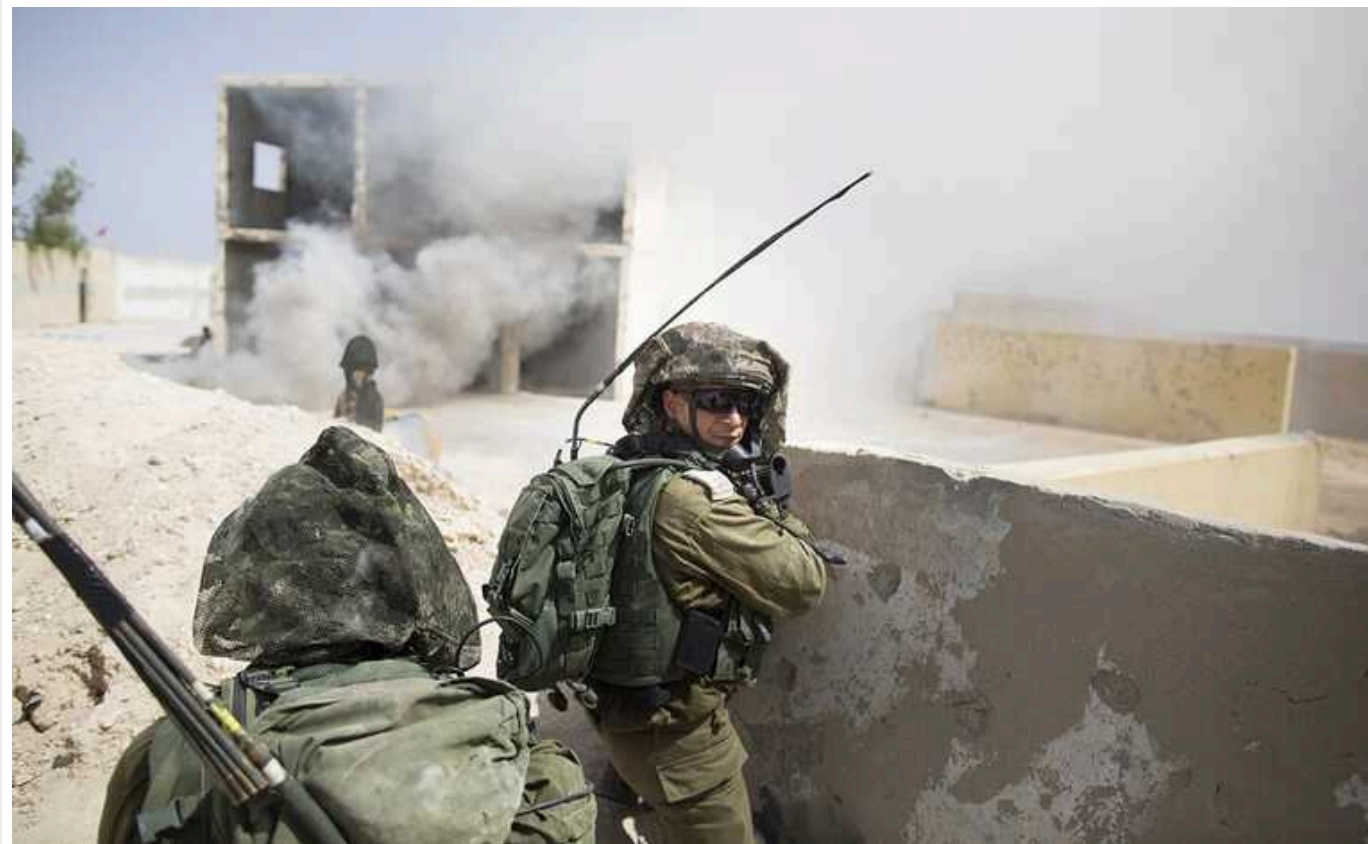
В Ізраїлі одностайно ухвалили рішення провести операцію в Рафасі з метою тиску на ХАМАС у питанні звільнення заручників

Канцелярія прем'єра Нетаньягу повідомила, що військовий кабінет Ізраїлю одностайно ухвалив рішення провести операцію в Рафасі з метою тиску на ХАМАС у питанні звільнення заручників.