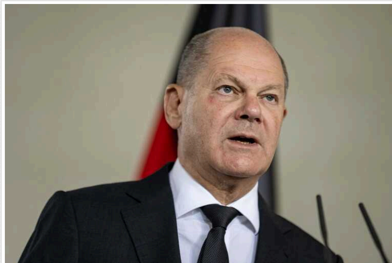
У ЄС досягли консенсусу щодо використання 90% доходів від заморожених активів РФ на військові потреби України, – Шольц

Канцлер ФРН Олаф Шольц заявив, що в Євросоюзі досягли консенсусу щодо використання 90% доходів від заморожених активів РФ на військові потреби України.