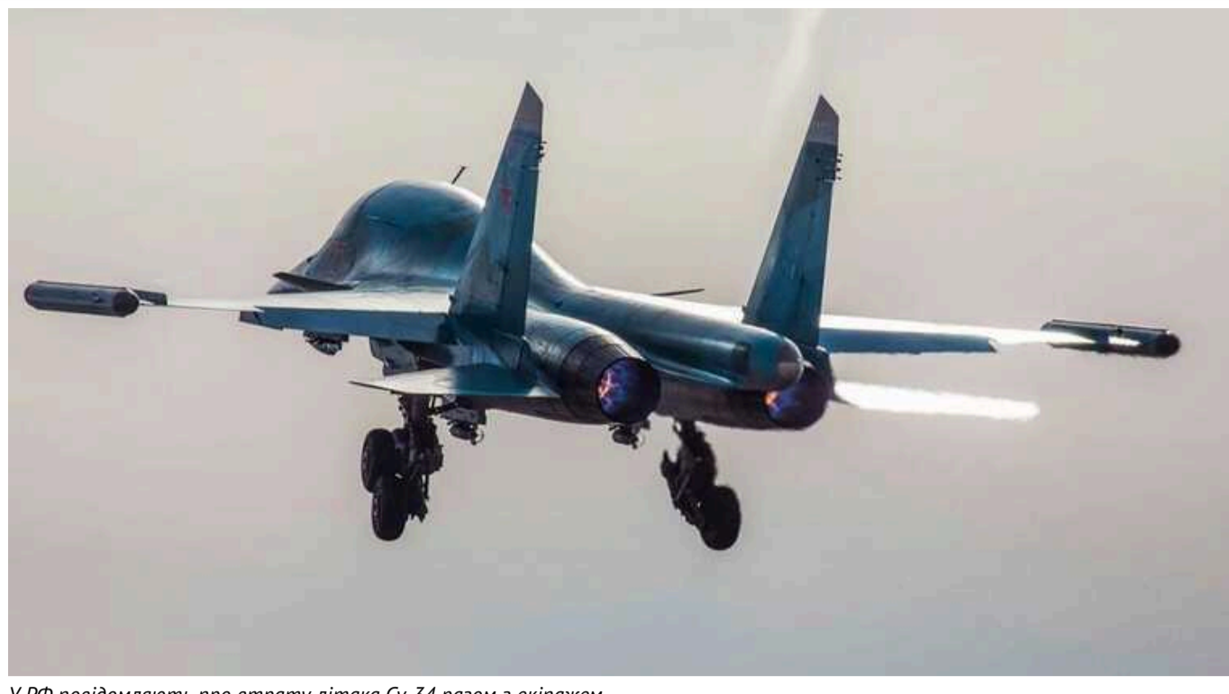
У РФ повідомляють про втрату літака Су-34 разом з екіпажем

У Росії повідомляють про падіння літака Су-34. Зазначається, що екіпаж бомбардувальника загинув.