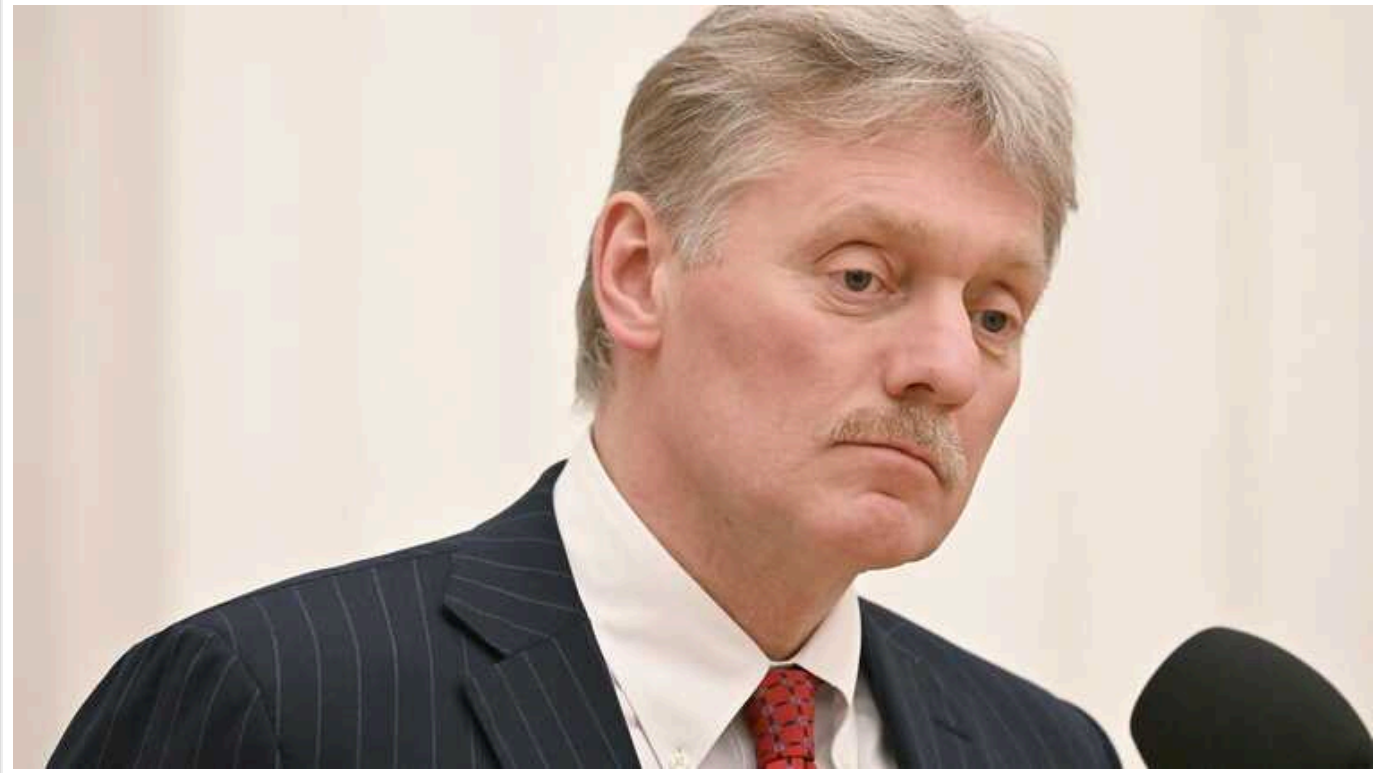
РФ загрожує «стрімкою реакцією» на заклики вести війська НАТО в Україну, - Песков

Речник Кремля Дмитро Песков загрожує «стрімкою реакцією» на заклики вести війська НАТО в Україну.