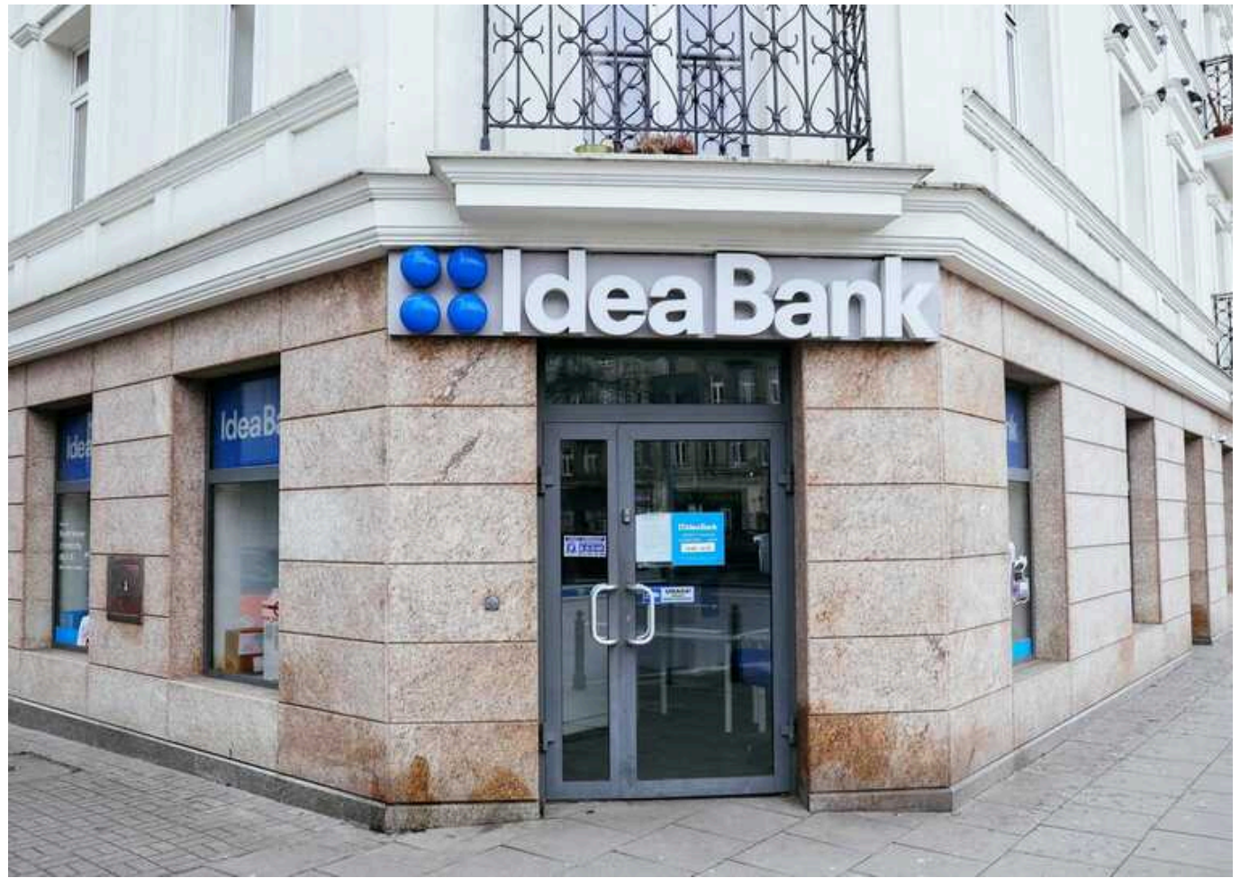
Нацбанк вимагає від Getin Holding продати Ідея Банк упродовж пів року

НБУ дає шість місяців Getin Holding на продаж його 100% частки в статутному капіталі Ідея Банку, йдеться в повідомленні холдингу на Варшавській фондовій біржі.