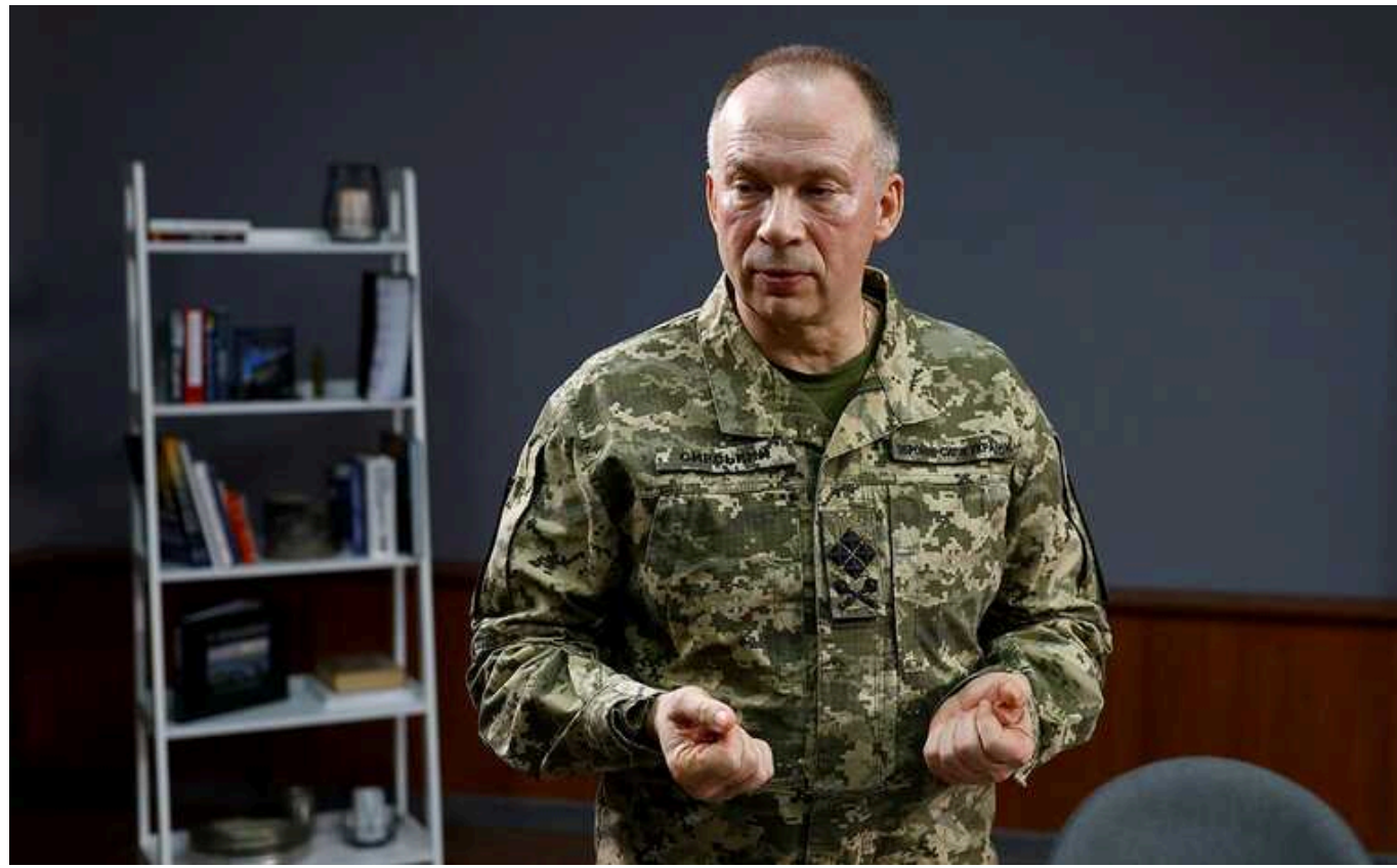
Окупанти намагаються вийти до Курахового та Покровська, - Сирський

На східному фронті наразі складна ситуація. Російські загарбники намагаються вийти до великих населених пунктів Курахове та Покровськ.