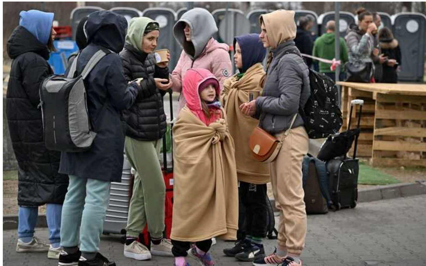
У Нідерландах більше не раді українським чоловікам-біженцям

“Українським чоловікам більше не раді” у головному пункті прийому біженців у Нідерландах.