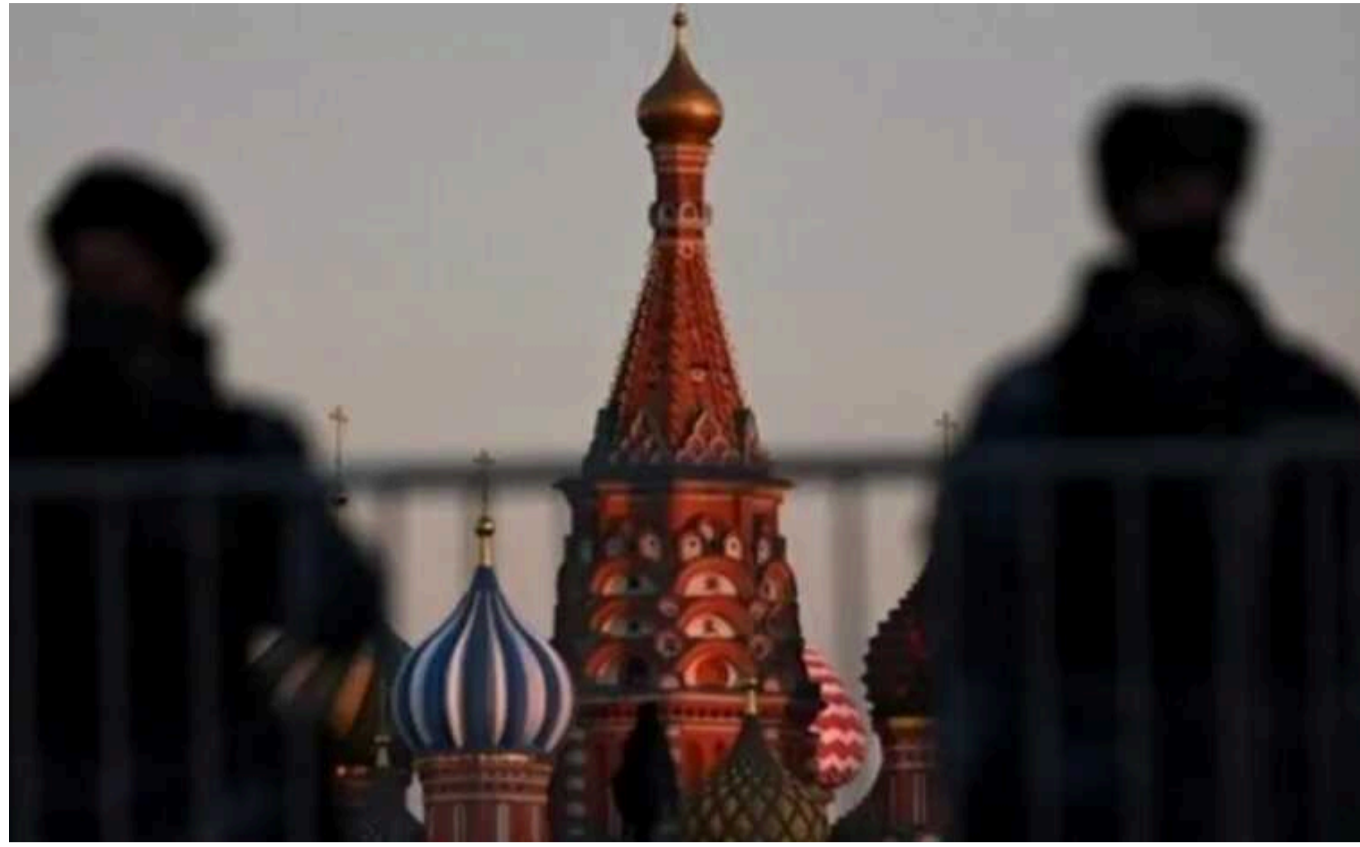
У Фінляндії назвали мету можливих диверсій РФ в Європі

У Фінляндії прокоментували інформацію про те, що країна-агресор Росія планує диверсії проти європейських держав – від вибухів та підпалів до інших пошкоджень інфраструктури. У Гельсінкі впевнені, що мета Москви – підірвати підтримку України з боку Європи.