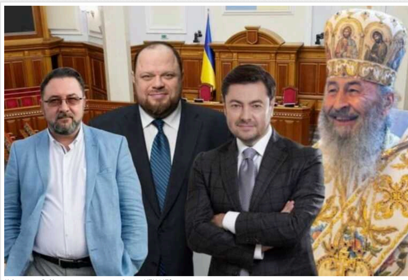
Куди зник у Раді законопроект про заборону УПЦ МП?