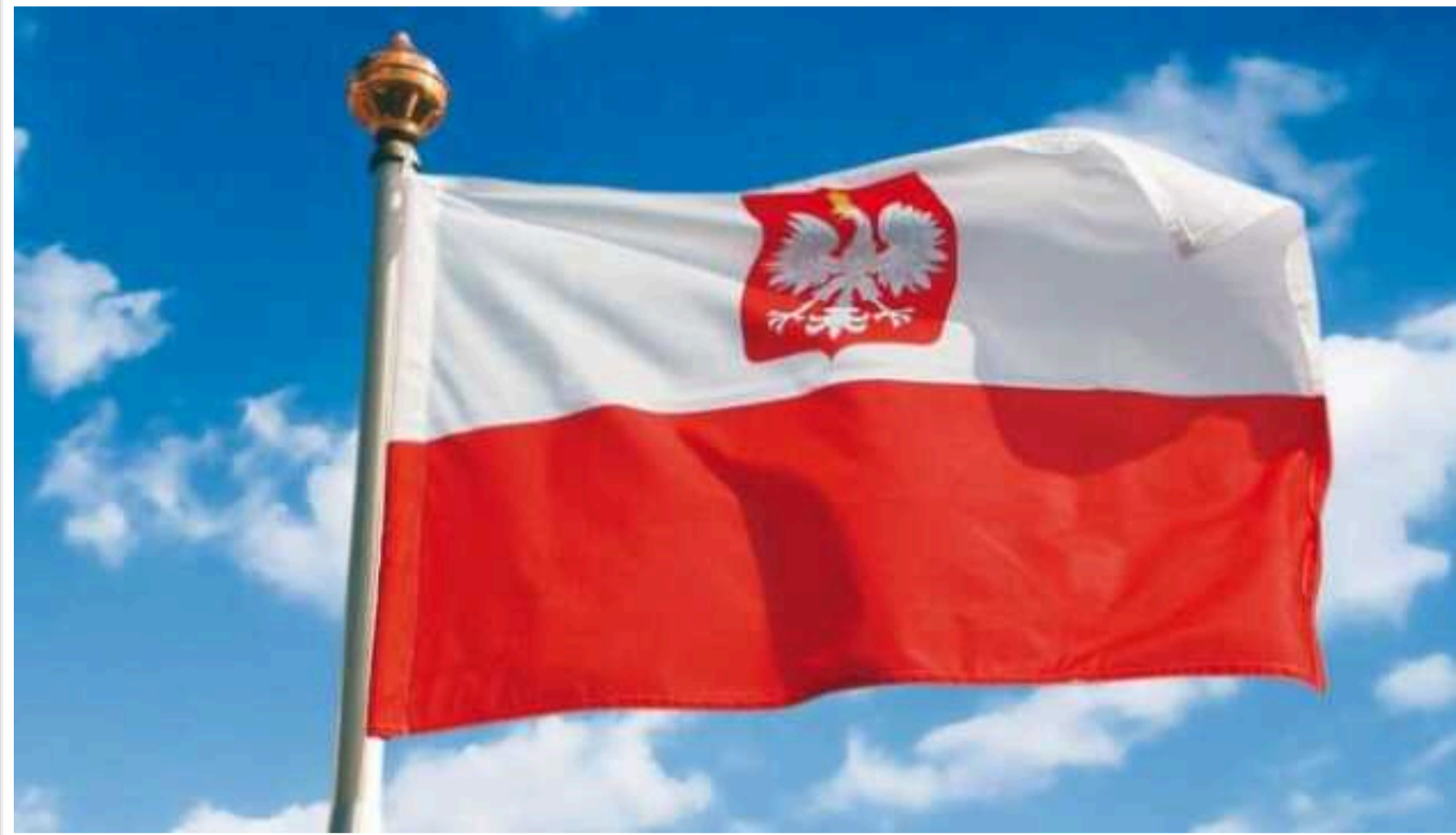
У Польщі зростають ксенофобські настрої і чому за цим можуть стояти спецслужби РФ

З кожним тижнем з'являється все більше повідомлень про випадки ксенофобії та злочинів на національному ґрунті на території Польщі, найближчого сусіда та партнера України.