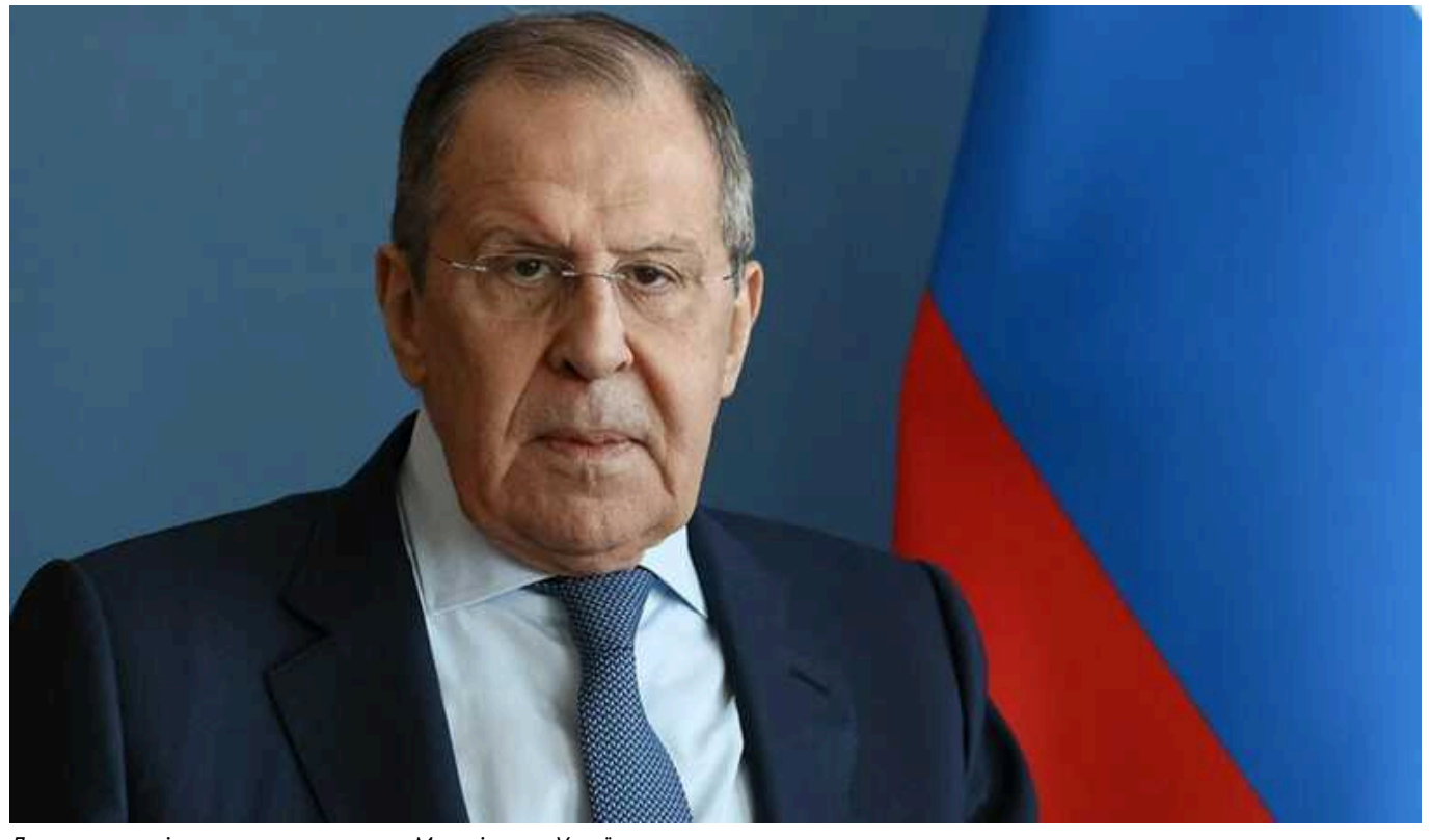
Лавров розповів, як реагуватимуть у Москві, якщо Україна запропонує переговори

Лавров назвав формулу миру президента Володимира Зеленського "ілюзорною і русофобською".