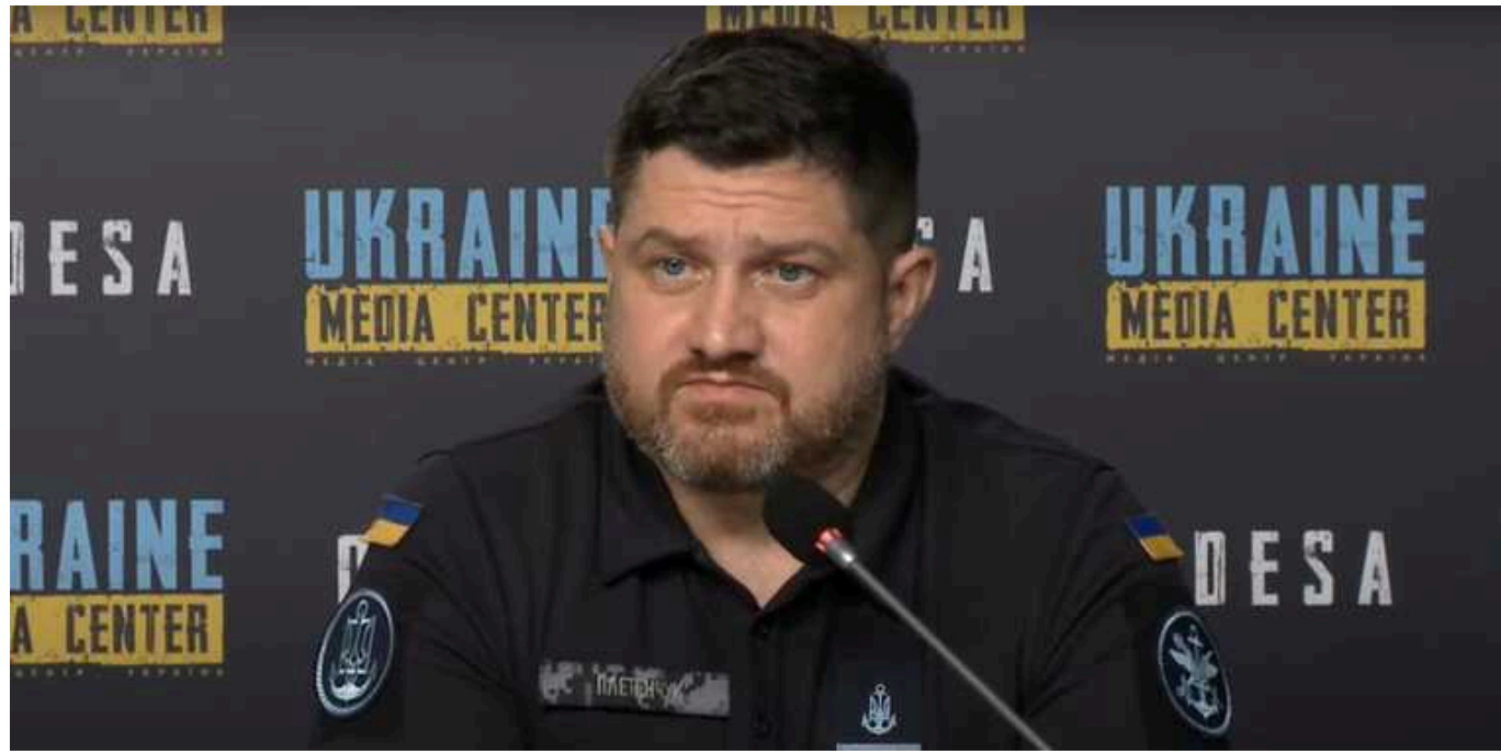
Окупанти спробували знову захопити острів Нестрига, – Плетенчук

Російські окупанти знову намагалися захопити острів Нестрига, який українські захисники нещодавно повернули під контроль України. Також загарбники 9 разів штурмували Південний напрямок.