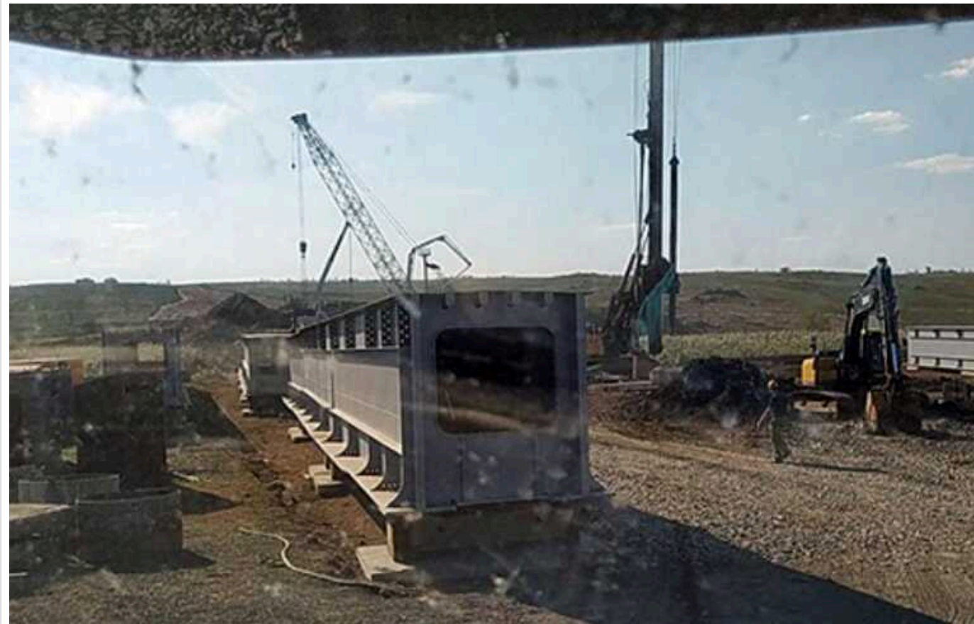
Андрющенко розповів про будівництво загарбниками залізниці через окуповані території

Росіяни планують запустити рух цієї гілки із Ростова через Маріуполь і Бердянськ до Криму до кінця 2024 року.