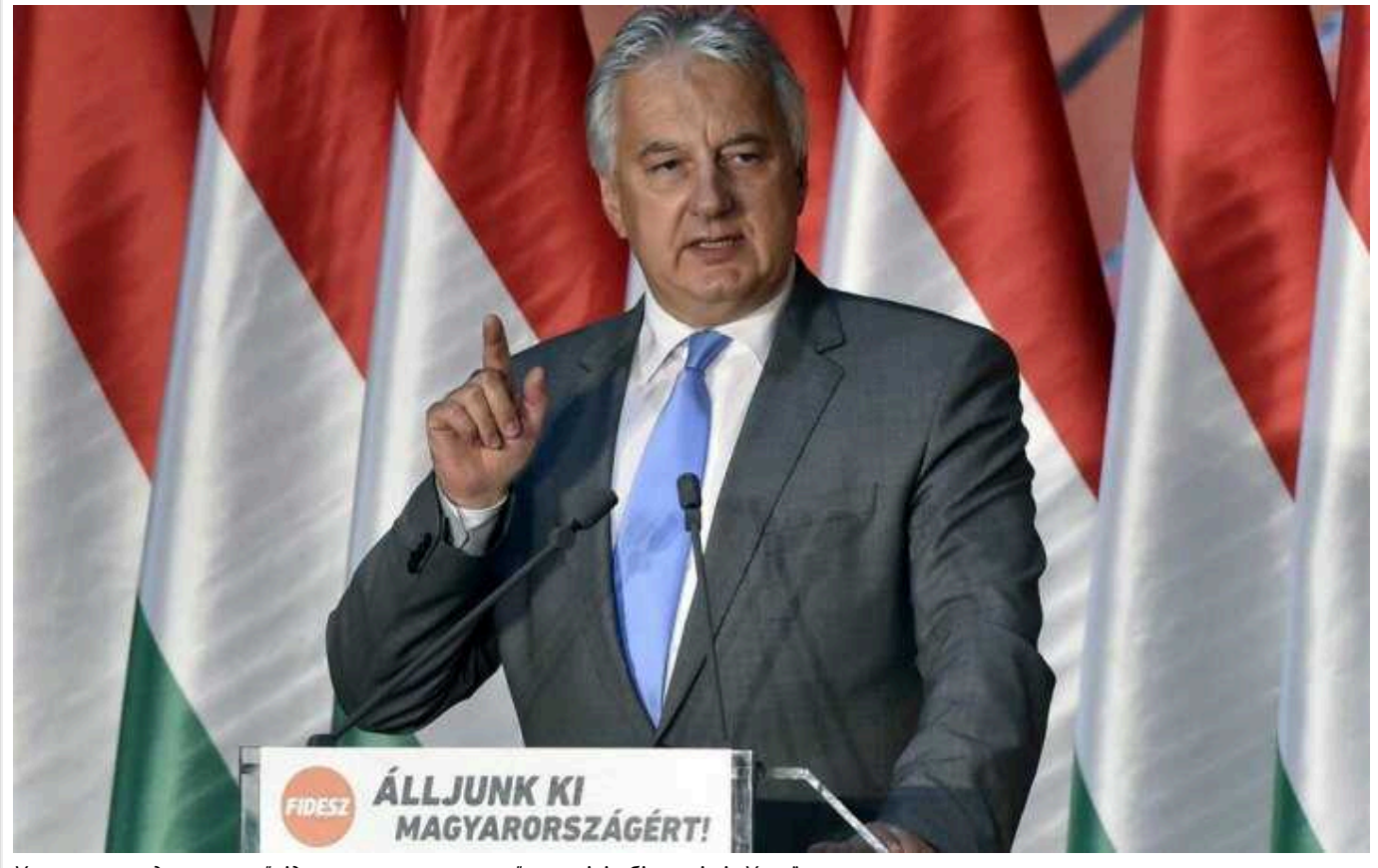
Угорщина не дозволить "відправляти на смерть" чоловіків-біженців із України

Віцепрем'єр-міністр Угорщини Жолт Шем'єн заявив, що Будапешт не буде передавати Києву українських чоловіків-біженців призовного віку.