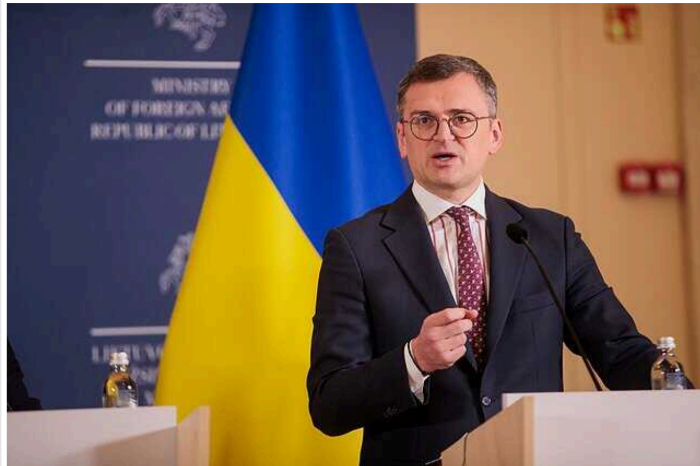
В МЗС назвали три складові для успіху розвитку європейського оборонпрому

Глава українського зовнішньополітичного відомства Дмитро Кулеба вважає, що є три складові, від яких залежить успіх розвитку європейської оборонної промисловості.