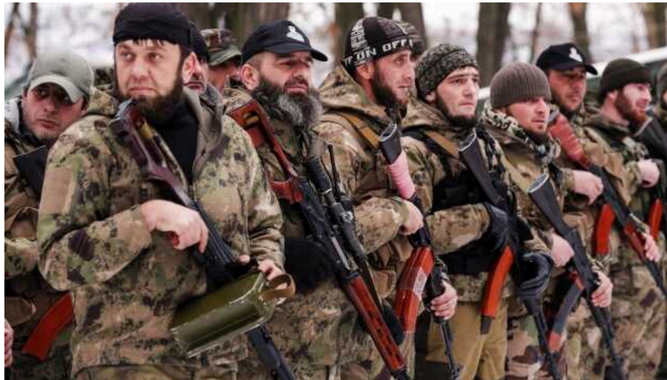
Британська розвідка розповіла, скільки "кадірівців" продовжують воювати в Україні

Британська розвідка проаналізувала, яку роль нині виконують проросійські чеченці, більш відомі як "кадірівці", на полі бою у війні РФ проти України.