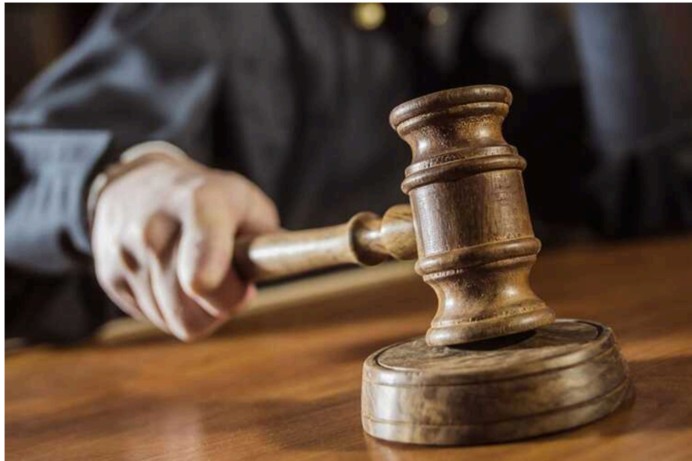
На Київщині судитимуть депутата та його спільників за шахрайство із землею

У Київській області судитимуть злочинну групу, яку очолював депутат однієї з територіальних громад Бориспільського району. За версією слідства, зловмисники причетні до шахрайства із землями регіону на суму понад 1,6 млн грн.