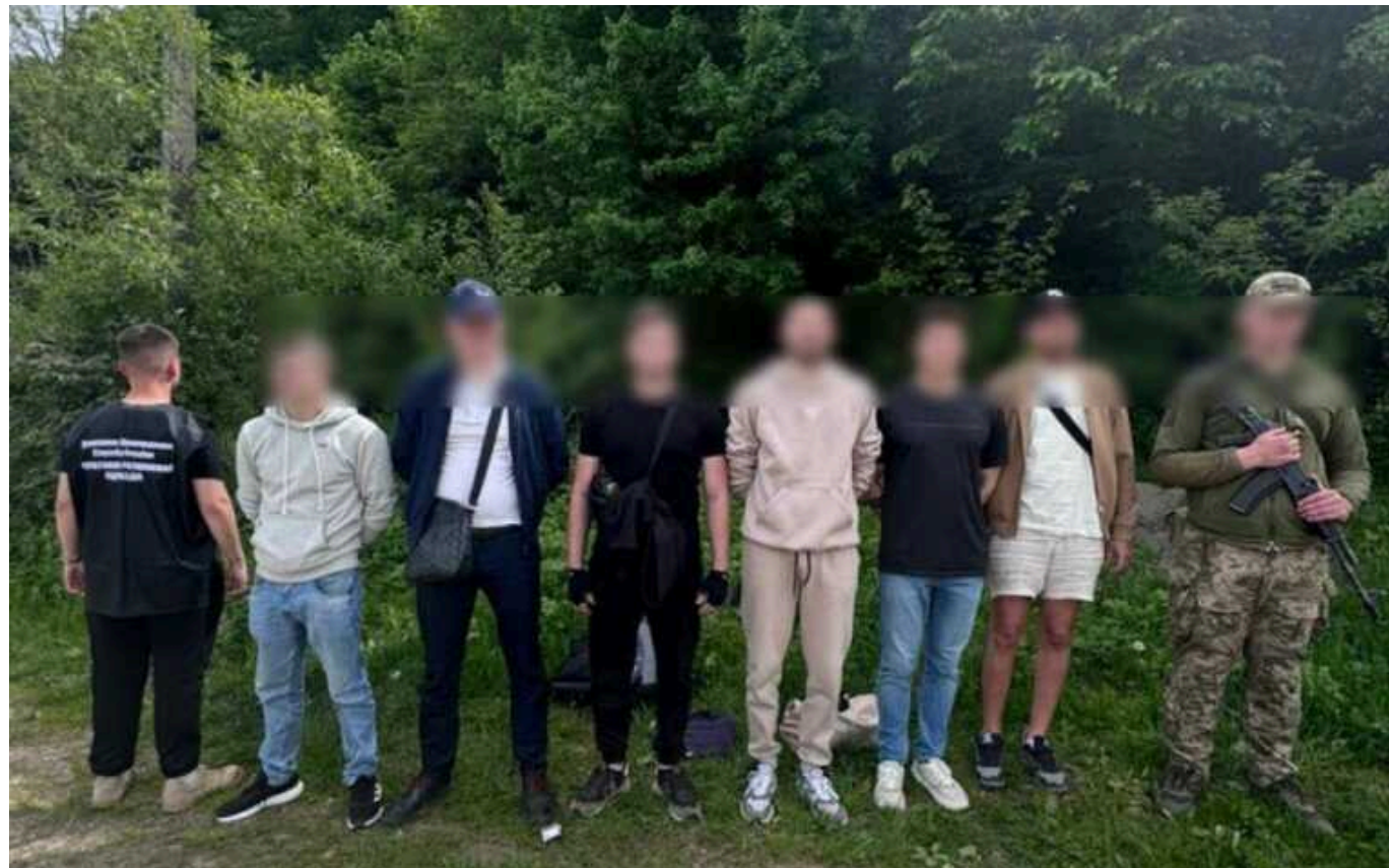
На Закарпатті затримали групу чоловіків, які заплатили за «турпохід» 48 000 доларів

У Закарпатській області прикордонники Мукачівського загону затримали шістьох чоловіків, які планували в обхід пунктів пропуску потрапити в Румунію. За "турпохід" мандрівники заплатили понад 48 тисяч доларів.