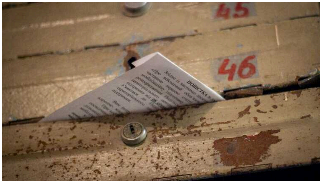
Як працюватимуть заочні штрафи для ухиянтів

Вони передбачені законопроектом 10379 про виправлення до адмінкодексу, який комітет Ради затвердив до другого читання.