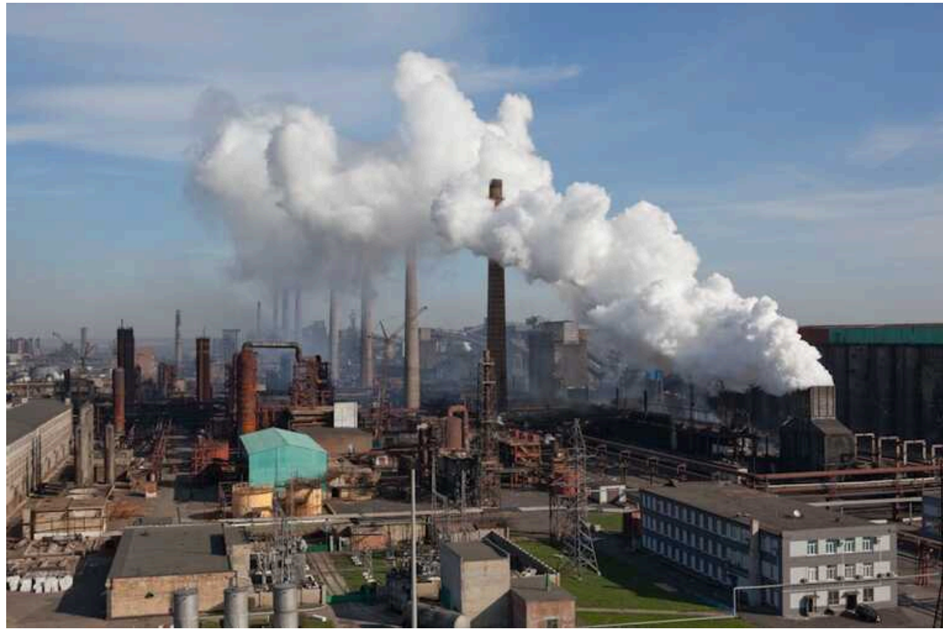
Окупанти вивозять залишки Авдіївського коксохіму на лом, – ЦНС

Російські загарбники після окупації Авдіївки (Донецька область) продовжують знищувати інфраструктуру міста, зокрема займаються "промисловим" мародерством. Ворог розпочав вивозити на метал устаткування розбитого ним місцевого коксохімічного заводу.