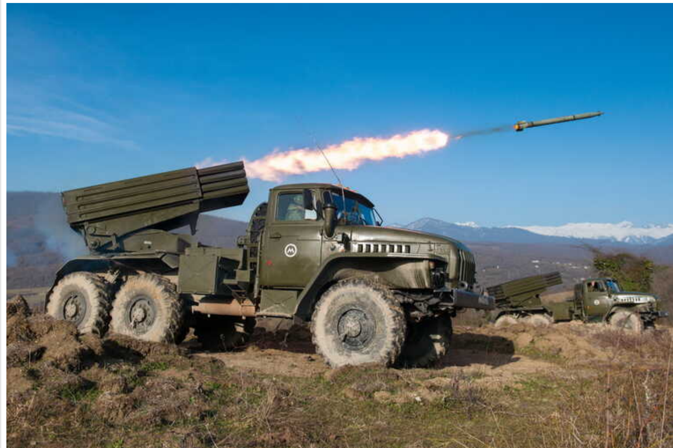
В окупованому Криму росіяни перекидають "Гради" вбік Херсонської області, - партизани

В окупованому Криму партизани зафіксували перекидання складу реактивних систем залпового вогню BM-21 "Град" у бік Херсонської області. Розвідники пообіцяли оперативно ліквідувати місце розташування техніки.