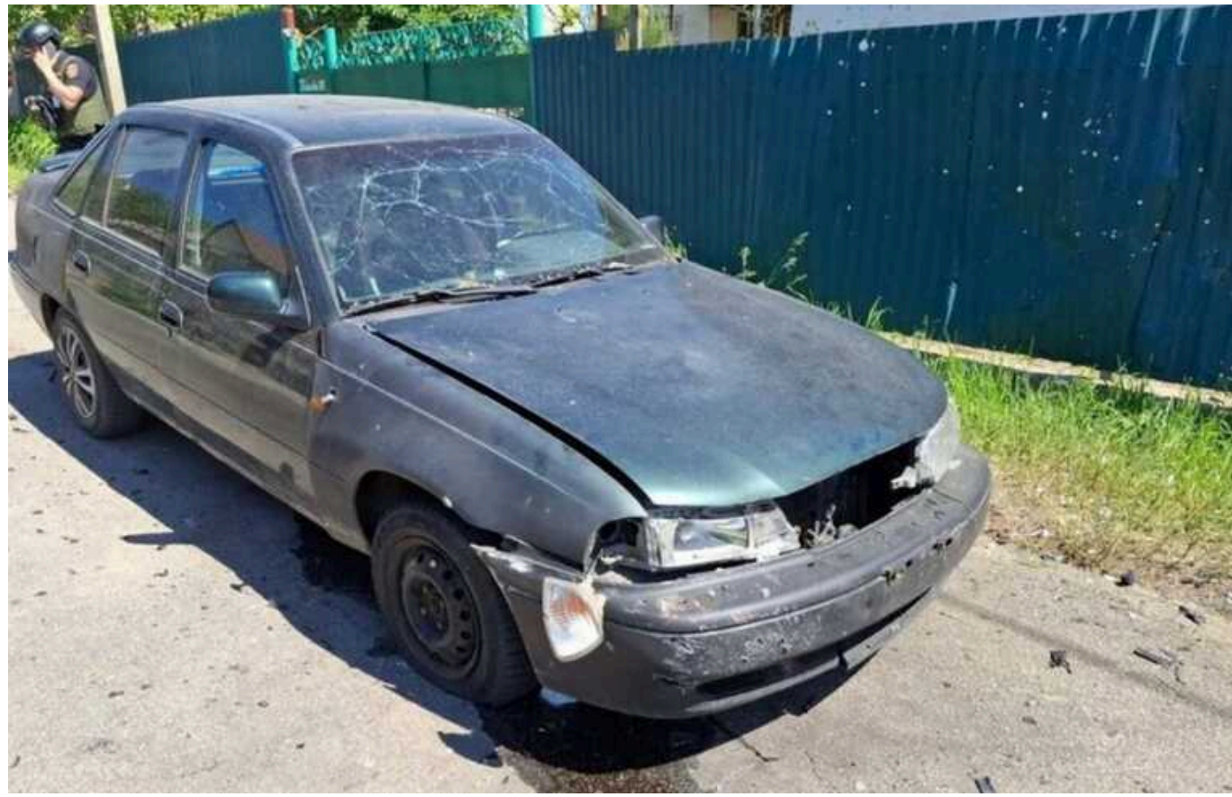
Окупанти обстріляли Нікопольщину: пошкоджено соціальний і два навчальні заклади, багатоповерхівки та ЛЕП

Сьогодні, 5 травня, окупанти атакували Нікопольський район Дніпропетровської області з артилерії та дронами-камікадзе.