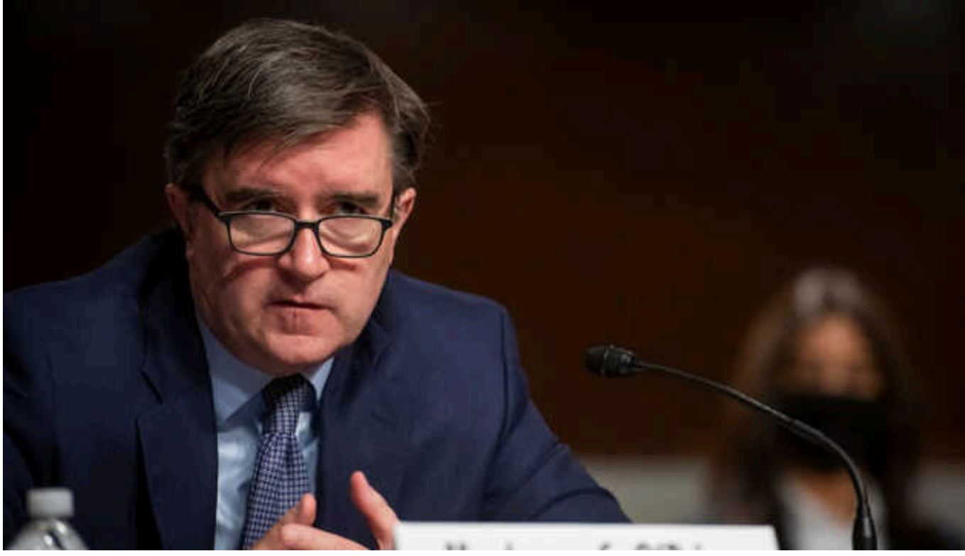
У Держдепі США нагадали владі Грузії, хто саме втягує її у війну

Помічник державного секретаря США з питань Європи та Євразії Джеймс О'Браєн нагадав лідерам партії влади "Грузинська мрія", що саме Росія намагається втягнути Грузію у війну, а не "західні сили".