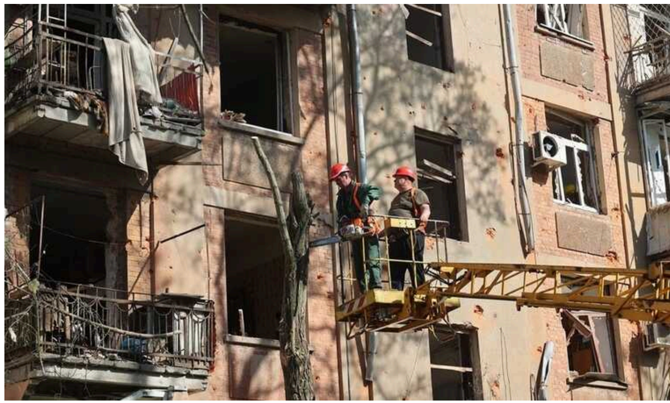
Кількість постраждалих унаслідок удару по Харкову зросла до 14

У Харкові кількість поранених унаслідок обстрілу Шевченківського району зросла до 14.