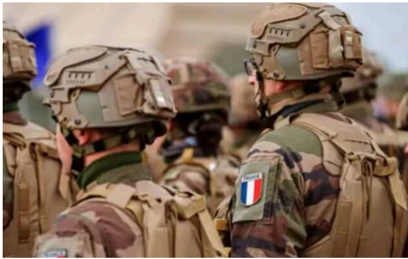
Ексклюзивник Пентагону Стівен Браєн стверджує, що Франція таємно направила своїх військових до України

Йдеться про військових Іноземного легіону з 3-го французького піхотного полку, яких, за твердженням Браєна, розмістили у Слов'янську для підтримки 54-ї бригади ЗСУ.