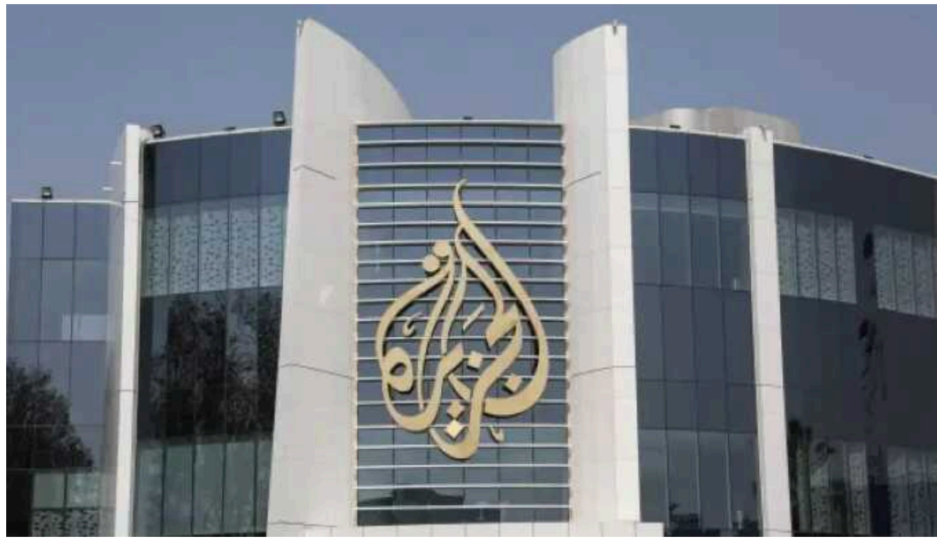
В Ізраїлі вирішили заборонити телеканал Al Jazeera в країні

Прем'єр-міністр Ізраїлю Беньямін Нетаньягу повідомив, що його уряд одногослоно проголосував за закриття місцевих представництв катарського телеканалу Al Jazeera.