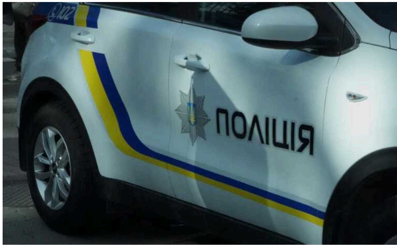
У Кривому Розі "працює" банда підлітків, які нападають на перехожих