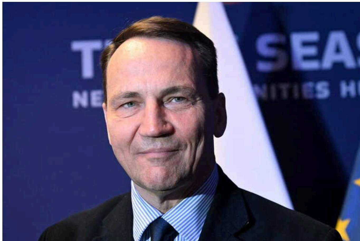
Хочемо якнайкращих відносин із США, хто б не був президентом, - Сікорський

Міністр закордонних справ Польщі Радослав Сікорський заявив, що Варшава прагне підтримувати гарні відносини зі Сполученими Штатами незалежно від того, хто переможе на президентських виборах 2024 року.