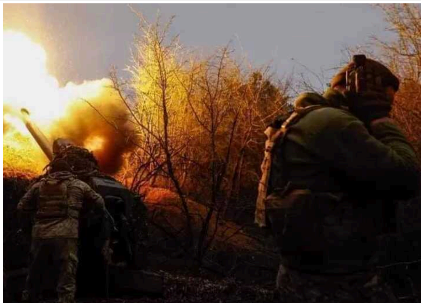
Росіяни зосереджують сили на Авдіївському напрямку

Росіяни активно стягують війська на Авдіївський напрямок. Вони прагнуть максимально розширити плацдарм і здійснити прорив української оборони.